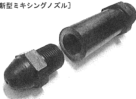
【新型ミキシングノズル】